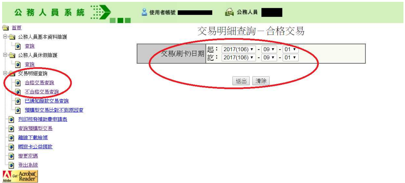
附表 9 國民旅遊卡檢核系統列印說明